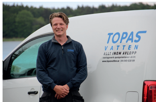
Topas Service är uppbyggt med ronderande servicetekniker som arbetar med planerad service. Vid larm kan man ställa om till felavhjälpning och avhjälpa akuta problem.